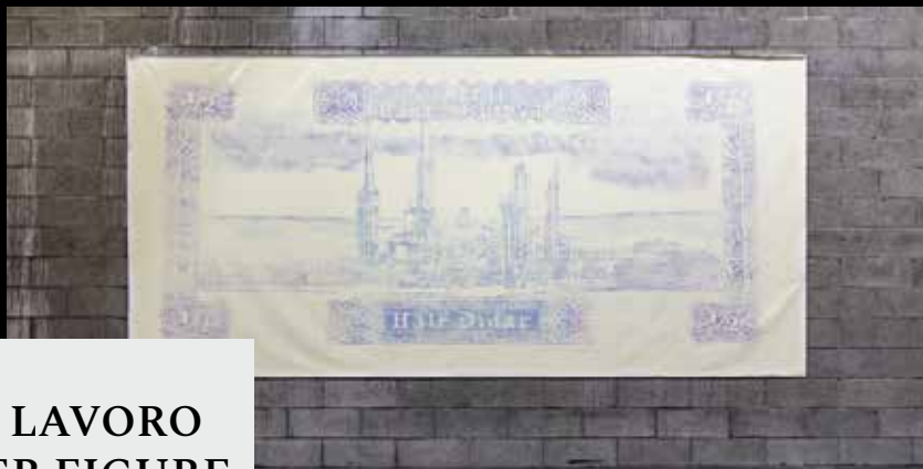
Flavio Favelli, Half Dinar, smalto su tela 220x461 cm, 2018 ph Gianluca "naphtalina" Camporesi