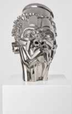
Victor Fotso Nyie, Autoritario, ceramica smaltata e platino 38x25x30 cm 2020