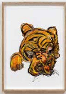
Matteo Fato, primo studio per le giuste distanze, 2020 olio su carta da incisione calcografica, 50 x 70 cm cornice in multistrato