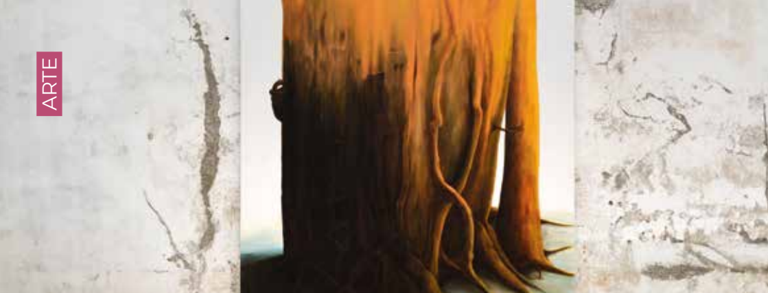
Simone Berti, Senza titolo , 2004. Olio su tela, 250 x 200cm. Courtesy l'artista. Fotografia di Michele Alberto Sereni.