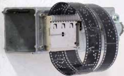
Tommaso Silvestroni A ritmo delle rimozioni , 2023. Carillon a schede forate, motoriduttore, negativi fotografici 35mm, batteria, acciaio zincato, movimento, suono, 20x30x15cm. Courtesy l'artista.